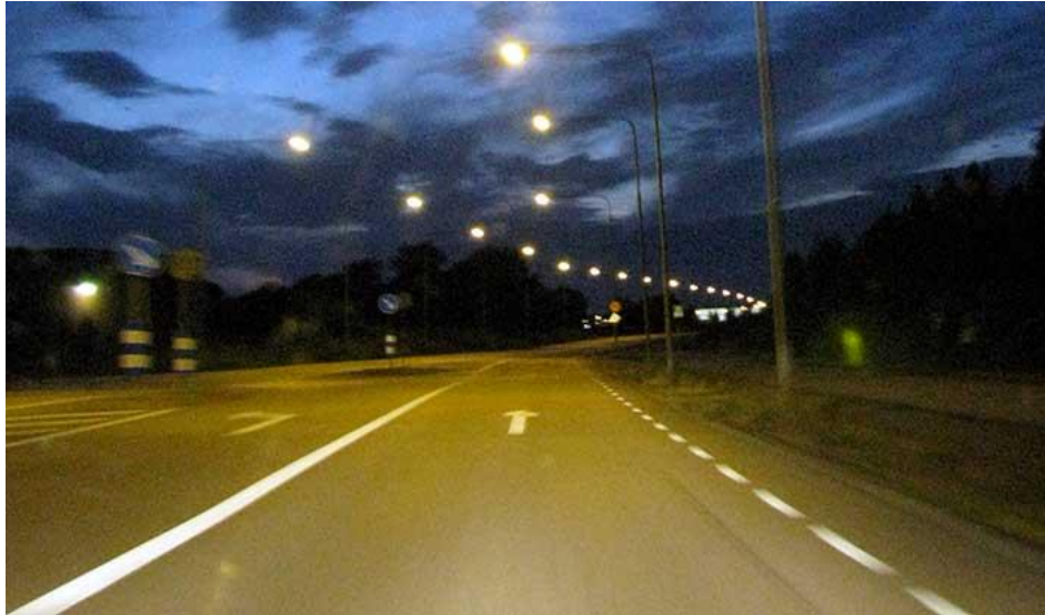
Tveksamt om helljus behövs här.

Helljus är bilens starkaste belysning. Använd dem så ofta du kan när det är mörkt ute. Eftersom helljusen är så starka, kan de blända andra trafikanter.