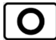
Lokal slinga (F30)