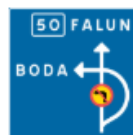
Orienteringstavla vid förbjuden sväng i korsning (F2)