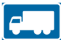
Märke för visst fordonsslag eller trafikantgrupp (F31)