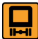
Farligt gods (F32)