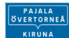
Samlingsmärke för vägvisning (F9)