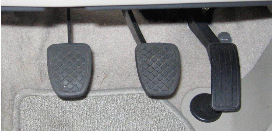
KOPPLING – BRONS – GAS