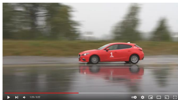
Minska bromssträckan – så gör du

https://www.youtube.com/watch?v=cQfH0uZpYR8