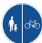
Påbjudna gång- och cykelbanor