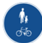
Påbjuden gång- och cykelbana