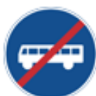
Slut på påbudsbana, körfält, väg eller led