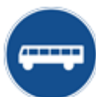
Påbudet körfält eller körbana för fordon i linjetrafik m.fl.