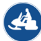
Påbjuden led för terrängmotorfordon och terrängsläp