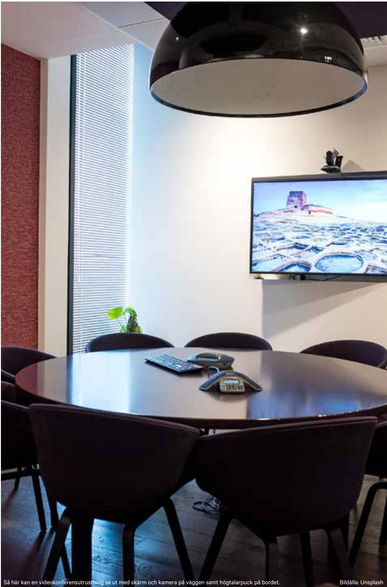
Så här kan en videokonferensutrustning se ut med skärm och kamera på väggen samt högtalarpuck på bordet.