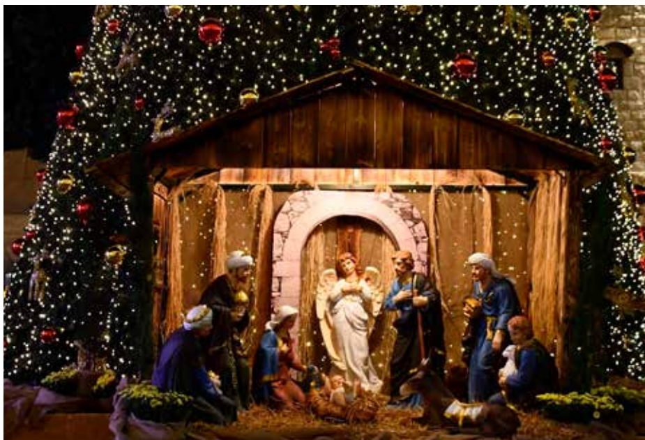
Julkubban framför den stora julgranen vid Födelsekyrkan i Betlehem

gör han sig liten som ett barn. Inkarnationens mysterium. Det var extra påtagligt i gudstjänstens avslutning när "Jesusbarnet" rent fysiskt, med ömhet, bars från St Catherines Church till Födelsekyrkans grotta. Man kunde nästan ta på glädjen och tacksamheten som fyllde kyrkorummet genom de smäktande tonerna från "Gloria in Excelsis Deo".