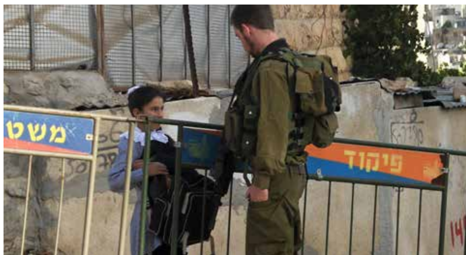
I Hebron finns konflikten mellan palestinier och israeler i koncentrerad form. Här råder en princip som skiljer människor åt.

Mer information om resorna finns på Bildas hemsida www.bilda.nu/mellanöstern