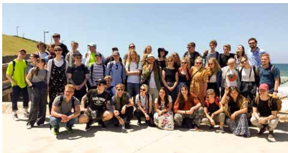
Resegruppen från Södra Vätterbygdens folkhögskola

Foto Amos Oz: Copyright/fotograf: Zhang Lei