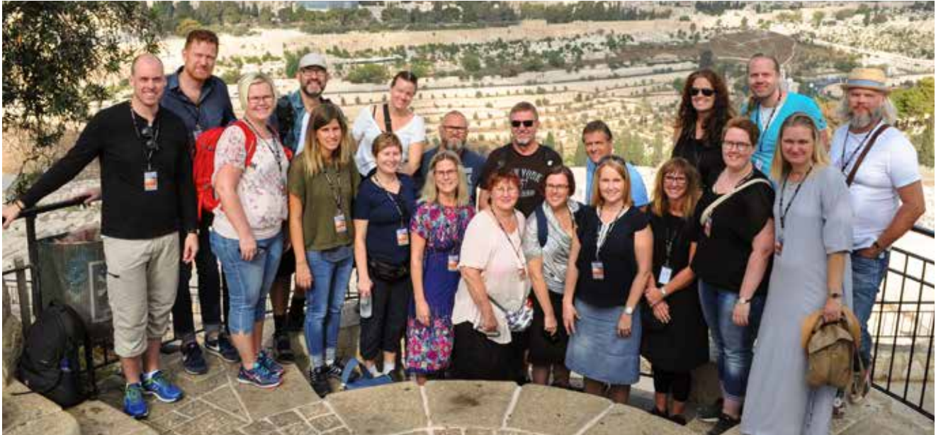
Favorit i repris. En grupp pastorer, musikedare och kantorer reste till Israel och Palestina för att skriva sånger.